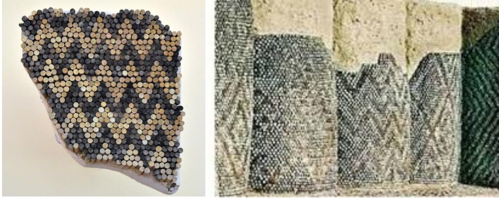
أعمدة مدينة أوروک

ومن الأمثلة أيضاً التي مهدت الطريق لظهور هذا الفن في بلاد ما بين النهرين؛ كانت أعمدة زخرفها السومريون أنفسهم بطراز اشتهر في التاريخ بأنه شبيه الفسيفساء. وعثر علي هذه الأعمدة بمدينة أوروک في مطلع القرن الثلاثين ق.م، هذا بالإضافة إلي المناظر المصورة علي بوابة عشتار في مدينة بابل.