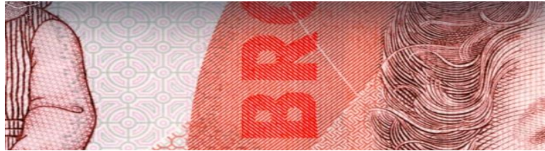
شكل رقم (٤) يوضح صورة مكبرة لجزء في ال ٥ دولار استرالي بعد الامالة.