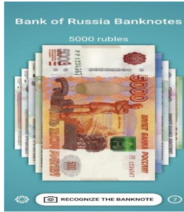
شكل رقم (٦) يوضح التطبيق الروسي يعرض كافة الفئات الرسمية والمستخدمة حالياً.

ويعتبر هذا التطبيق تفاعلي هو الآخر بحيث يمكنك ألا تحتاج لأن تنظر إلى البنكنوت حيث يعمل أيضاً من خلال تفاعل المستخدم والتعرف على كافة العلامات التأمينية في العملة الروسية، كما بالشكل رقم (٧)، حيث توضح الصورة على اليمين أيقونة Feel فمعناها هي كل علامة تأمينية يمكن معرفتها أو التعرف عليها من خلال احساس لمس الورق. ما صورته على اليسار فهي تعني التعرف على كل علامة تأمينية يمكن معرفتها أو التعرف عليها من خلال الرؤية أو رفع الهاتف. (٨) (٩) (١٠)