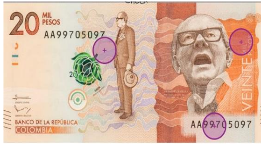
شكل رقم (١) يوضح صورة مأخوذة من التطبيق الكولومبي لأحد العملات الكولومبية.