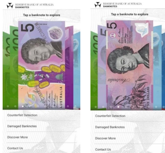
شكل رقم (٢) يوضح الاصدار القديم على اليمين والاصدار الحديث على اليسار من فئة ال ٥ دولار استرالي في التطبيق.

يسمى هذا التطبيق RBA Banknotes، ويعتبر هذا التطبيق هو المستخدم في دولة استراليا بهدف توعية الجمهور بالعلامات التأمينية في العملة الخاصة بدولتهم حتى لا يقع أحد المواطنين ضحية للمزيفين والمزورين، والذي تم اصداره في عام ٢٠١٦ أيضاً.