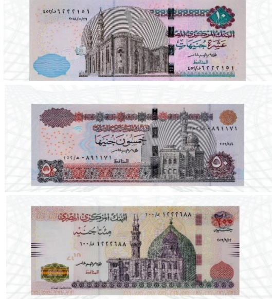
شكل رقم (٨) مثال لشريط عرض العملات الورقية المصرية بالتطبيق.

أما الجزء الثاني وهو "الكشف عن البنكوت" ففيه يتم استخدام الكاميرا للتعرف على فئة البنكوت وبعدها يتم الكشف عنها إذا كانت سليمة أم مزيفة، حيث يقوم المستخدم بتصوير العملة في اضاءة جيدة وليست ضعيفة بحيث تكون الصورة للعملة كاملة أو تصوير جزء منها الذي به رقم فئة العملة مثل ٥، ١٠، ٢٠، ٥٠، ١٠٠، ٢٠٠ جنيه. (٥)