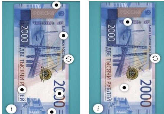
شكل رقم (٧) يوضح على اليمين عناصر احساس الورق Feel، وعلى اليسار عناصر الرؤية والرفع Lift&Look.

ويعتبر هذا التطبيق تفاعلي هو الآخر بحيث يمكنك ألا تحتاج لأن تنظر إلى البنكنوت حيث يعمل أيضاً من خلال تفاعل المستخدم والتعرف على كافة العلامات التأمينية في العملة الروسية، كما بالشكل رقم (٧)، حيث توضح الصورة على اليمين أيقونة Feel فمعناها هي كل علامة تأمينية يمكن معرفتها أو التعرف عليها من خلال احساس لمس الورق. ما صورته على اليسار فهي تعني التعرف على كل علامة تأمينية يمكن معرفتها أو التعرف عليها من خلال الرؤية أو رفع الهاتف. (٨) (٩) (١٠)