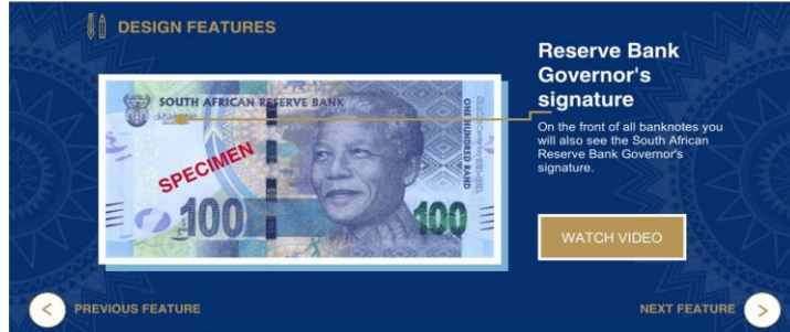
شكل رقم (٩) يوضح صورة مأخوذة من التطبيق SARB لأحد الفئات. ولقد حاز هذا التطبيق على جائزة Global Recognition

يعتبر هذا التطبيق والذي يسمى SARB Currency application هو المستخدم في دولة جنوب أفريقيا والذي تم اصداره في يوليو ٢٠١٨، حيث يعرض التطبيق كافة فئات العملة الخاصة بدولة جنوب أفريقيا ويعرض كافة العلامات التأمينية الموجودة بها كما هو موضح بالشكل رقم (٩). (٨) (٩) (١٠) ”International Association of currency affairs award“ وذلك في مايو ٢٠١٩. كأفضل تصميم تطبيق في هذا النوع من التطبيقات في عام ٢٠١٩. كما يوجد العديد من الدول الأخرى التي أصدرت هذه التطبيقات الذكية لحماية اقتصادها من عمليات التزييف والتزوير للبنكوت الخاص بها، وكذلك لتثقيف شعبيها للحد من عمليات الاحتيال التي قد تحدث.