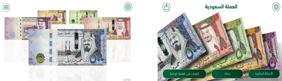
شكل رقم (٥) يوضح تطبيق المملكة العربية السعودية SAMA.

يعد تطبيق "العملة السعودية"، أداة تفاعلية للتعرف على الإصدار السادس من الأوراق النقدية السعودية، ويتيح هذا التطبيق للمستخدمين التعرف على العلامات الأمنية في الإصدار السادس من الأوراق النقدية الجديدة الذي تم طرحه للتداول في عام ٢٠١٧م. ويوضح بطريقة تفاعلية كيفية استجابة العلامات الأمنية عند إمالة الورقة النقدية، أو تسليط الضوء عليها، أو عند استخدام عدسة مكبرة، كما بالشكل رقم (٥). (٧)