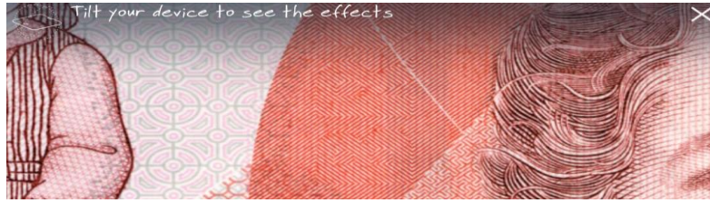
شكل رقم (٣) يوضح صورة مكبرة لجزء في ال ٥ دولار استرالي قبل الامالة.