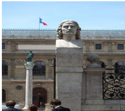
شكل ٢ مدخل المدرسة الوطنية العليا للفنون الجميلة ويظهر فيه تمثال نصفي للرسام الفرنسي نيكولا بوسان.

كما يذكر (موقع marefa.org ) ان المدرسة الوطنية العليا للفنون الجميلة ، هي الأكاديمية العليا للفنون الجميلة التي تقع في باريس فرنسا. تتألف المدرسة الوطنية العليا للفنون الجميلة من مجمع مباني في جهة متحف اللوفر. تأسست المدرسة عام ١٦٤٨ تحت حكم الملك لويس الرابع عشر بواسطة شارل لوبران على غرار الأكاديمية الفرنسية للرسم والنحت التي نشأت في روما وكان نيكولا بوسان احد مؤسسيها الاوائل. في عام ١٦٦١ ، عملت الأكاديمية الملكية للرسم والنحت تحت إشراف وزير المالية لويس الرابع عشر جان بابتيست كولبير ، والذي اختار شخصياً تشارلز لو برون (١٦١٩-١٦٩٠) كمدير للأكاديمية. عام ١٧٩٣، في أثناء اندلاع الثورة الفرنسية، فُتمت المعاهد. إلا أنه في عام ١٨١٦ عادت من جديد بعد تغيير اسمها في أعقاب دمجها مع الأكاديمية الملكية للعمارة. كانت تحت وصاية الملك حتى ١٨٦٣، بموجب مرسوم إمبراطوري صدر في ١٣ نوفمبر ١٨٦٣ تأسس منصب مدير المدرسة، ليخدم فترة خمس سنوات بعدما ظلت تحت إشراف وزارة الإرشاد العام لفترة طويلة، تعتبر مدرسة الفنون الجميلة حالياً مؤسسة عامة.