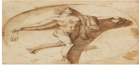
شكل ٦ Nicolas Poussin

هذه اللوحة الراقصة (شكل ٥) الأكثر شهرة لبوسان. أربع شخصيات وهمية تتكاتف وترقص على أنغام موسيقى قيثارة تايم. تؤكد دائرتهم الإيقاعية على كيفية دوران دورة الحياة من حالة إلى أخرى و اختلاف فصول العام. (شكل ٦) راقصة بوسان مغطاة بجلد أسود وتحمل وعاء نبيذ فارغ ،. يشير المخطط الدائري حول الراقصة وسقوط الظل إلى نقش عتيق ، وهو شكل من أشكال نحت الإغاثة. يوجد في (الشكل ٧) الصورة النحت الروماني، "الإغاثة مع خمسة راقصين قبل بورتيكو ("الراقصين البورغيزيين") ، القرن الثاني الميلادي. متحف اللوفر، باريس، قسم الآثار اليونانية و الأثرورية والرومانية.