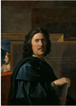
Nicolas Poussin self portrait , ١٦٥٠ oil on canvas , Louver , Paris