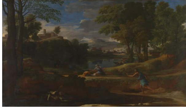
a Man killed by a Snake

تميز المشهد الطبيعي عند بوسان بجعل العنصر البشري عنصر ثانوي في المشهد و التركيز الرئيسي يكون على الطبيعي. كذلك تتميز الوانه بالوضوح القوه، كما انه يقوم بطرح الموضوع المنظر الطبيعي بطريقة كلاسيكية يربط بين موضوع ما و بين المشهد الخوي .