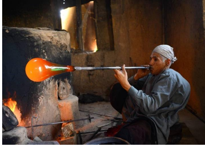
النفخ في الزجاج شكل (13)

وان المتخصص في الفراغ الداخلي لا يغيب عن خاطره الزجاج ودوره في تكوين تكاملي للفراغ الداخلي، فالزجاج منذ الازل، ومن يوم اكتشافه الانسان على الارض، اصبح هذه الخامة المهمة والتي تدخل في المعالجات المعمارية عدا طبعا الانية المنزلية xii . ومع تطور الانسان بدا يطور بيئته الداخلية سواء السكن او مكان العمل او المرافق العامة المختلفة من محلات تجارية ومدارس ومستشفيات .. الخ (شكل 14)، وكان همه تكوين توافق ما بين البيئة المحيطة والوظيفة التي ستحققها له، وبما ان الفراغ الداخلي يشكل هذه البيئة الكبيرة والشاملة، فكانت هي من جسدت القيم الجمالية الروحية والاحتياجات ايضا التي تخدم الانسان، والتصميم الداخلي تنوعت مدارسه واختلقت باختلاف الثقافات والعادات والتقاليد والطبيعة الجغرافية ، وبرغم هذا التنوع الكبير الا انها جميعا كانت تهدف الى ترتيب الاسس والعناصر للفراغ الداخلي لتحقيق هدف المنفعة والجمال، ولتلي في النهاية الغرض الذي صممت من اجله xiii .