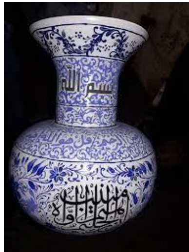
انية خزفية (شكل 7)