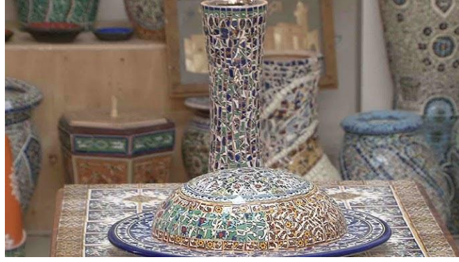
تصميمات جديدة من الخزف (شكل 3)

اهمية الدراسة : الخزف ومنه الفسيفساء، والزجاج وارتباطهما بالتاريخ الفلسطيني ودورهما في تعزيز الانتماء الوطني والحفاظ على الموروث، وربط الحرفتين في اعمال التصميم الداخلي والديكور بإضافة قطع مميزة منها الى الفراغ اصيلة وتلبي حاجة العصر الحالي.