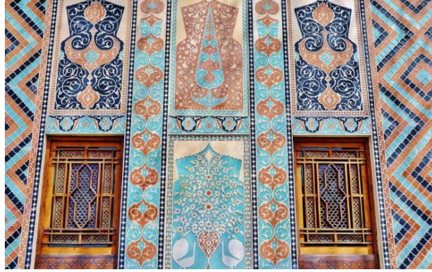
تزيين الجدران في الفسيفساء (شكل 12)

واليوم هناك متخصصين في عمل الجداريات واللوحات التي يبحث عنها المغرمون بهذا اللون من الفنون، ليقتنوها كتحفة فنية في بيوتهم، فيمكن ان يطلب تصميم خاص بالشخص، او ان تعرض اللوحات بمعارض خاصة للبيع، وتكون بمبالغ باهظة، تقديرا لقيمتها وتميزها. فالفسيفساء من الحرف التراثية الاصلية، فهي شاهدة على عراقة الموروث الفلسطيني وركن مهم في الحملات للحفاظ عليه، فهي تأتي من منطق ان من لا تاريخ له لا حاضر له، لذلك يقع على عاتق المؤسسات الحكومية والاهلية وحتى الاشخاص الموهوبون والحرفيون، مسؤولية الحفاظ على كافة اشكال المهارات والحرف الموروثة ومنها حرفة الفسيفساء، والتي تعبر عن عراقة امتنا وعمق تاريخها.