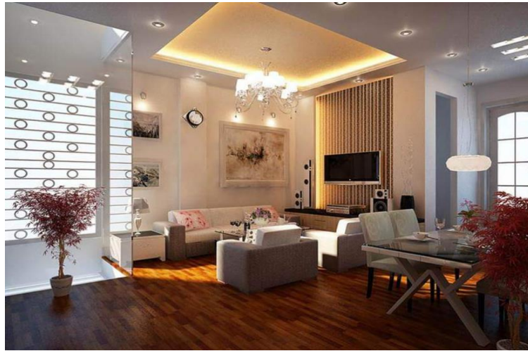
الاضاءة مع الديكور الداخلي شكل(19)