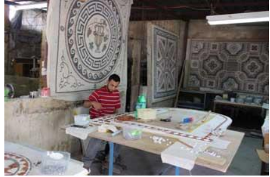
مشغل فسفساء دير ابو حجلة (شكل9)