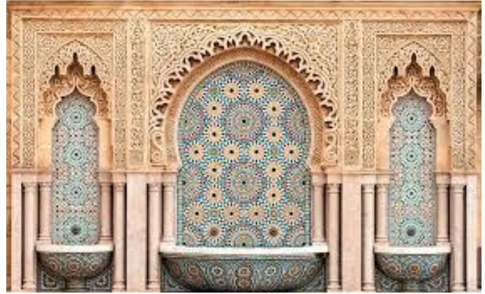
موزاييك مغربي (شكل 5)