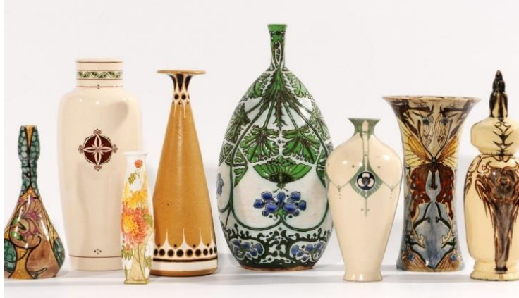
التنوع في زخارف الانية شكل(17)

من هنا ظهر في فلسطين فنانيين متخصصين في هذا اللون من الحرف، فعملوا على تطويره لكي ينسجم من الفكر الاسلامي والذي ينادي بالتحريم في محاكاة الاشكال الادمية والحيوانية، فجاءت الزخارف على اشكال هندسية ونباتية وخطية وخاصة القرآني والكوفي والنسخي. فالنوافذ اخذت اشكالا عدة هندسية منها الدائرية والرباعية والسداسية، حيث جاءت بشكل التزم بالنظام الهندسي مع الخطوط لتعمل على الحفاظ على الجاذبية في التصميم الفني ، من هنا جاء الانتاج الفني مدروسا ومنظما وليس عشوائيا وعبثيا، مع الحفاظ على السمة التجريدية التي توصلنا الى تصميم لافت للنظر ومميز. (شكل17).