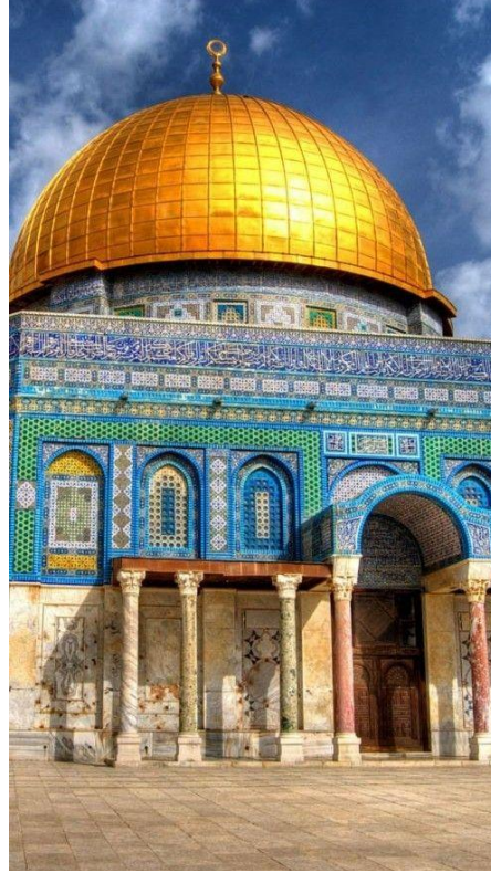
الزركشة في قبة الصخرة (شكل 11)

مرة اخرى وترص الحبيبات جنباً الى جنب كأنها لؤلؤا منثورا، وهذا دلالة على حياة العز والترف والتي تدل على غنى الدولة الاسلامية في ذلك الوقت، ليرز من خلالها الشأن الرفيع والمكانة العالية ix .