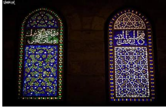
زجاج الشبابيك شكل (16)

من هنا ظهر في فلسطين فنانيين متخصصين في هذا اللون من الحرف، فعملوا على تطويره لكي ينسجم من الفكر الاسلامي والذي ينادي بالتحريم في محاكاة الاشكال الادمية والحيوانية، فجاءت الزخارف على اشكال هندسية ونباتية وخطية وخاصة القرآني والكوفي والنسخي. فالنوافذ اخذت اشكالا عدة هندسية منها الدائرية والرباعية والسداسية، حيث جاءت بشكل التزم بالنظام الهندسي مع الخطوط لتعمل على الحفاظ على الجاذبية في التصميم الفني ، من هنا جاء الانتاج الفني مدروسا ومنظما وليس عشوائيا وعبثيا، مع الحفاظ على السمة التجريدية التي توصلنا الى تصميم لافت للنظر ومميز. (شكل17).