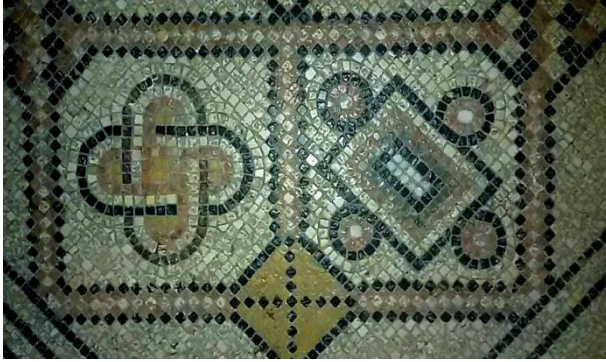
ارضية فسفساء صناعة دير ابو حجلة (شكل10)

اشتهرت في فلسطين صناعة الفسيفساء في الاديرة خاصة الموجودة في مدينة اريحا، منها دير ابو حجلة vi ، (شكل 9+10) فحتى اليوم هناك متخصصون مهرة في هذا المجال والذي يقوم عليه مدربين مهرة، ينتجوا اعمالا تخدم الكنائس بالدرجة الاولى، ليصنع جداريات تزين الحوائط، وزخارف فسيفسائية لتزيين الارضيات، وبعد انتشار الاسلام في فلسطين انتقل هذا الفن ليقدم المساجد والقصور، وابدعوا فيه من حيث الفكرة والتنفيذ وشاهدا على ذلك التحفة الفنية قبة الصخرة الشريفة، التي لا تزال شاهده على هذا اللون من الفنون vii .