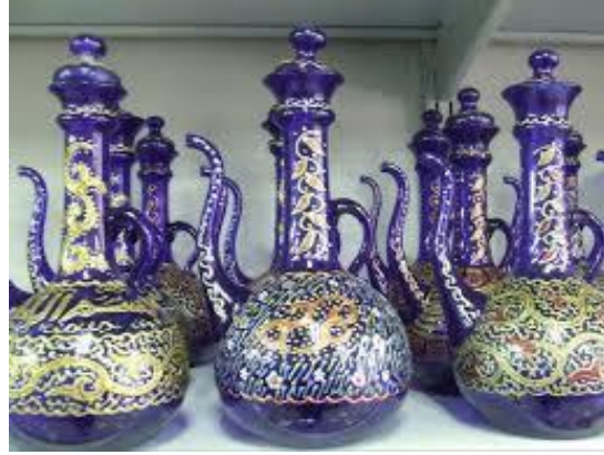
الابداع في التصميم الزجاجي شكل (18)

الزجاج كحرفة في فلسطيني وفرت طريقا لفن فريد يحقق الابداع والمتعة للمشاهد (شكل18)، فخلط الالوان وتنوعها وبأشكال متعددة حولت انتاجها الى معارض فنية محسوسة في الحياة العادية، وجزء من الفراغ الذي يعيش فيه الفرد ويستخدمه من جوامع ومدارس وبيوت، هذه التجربة البصرية التي صنعت تواصلها فنيا امتد الى عمق الحضارة الاسلامية. وبرغم ان التصميم كان اشبه بلوحة متكاملة الالوان والتصميم الا ان اضفاء اضاءة صناعية عليها مع عناصر الاثاث والسنانر والسجاد صنعت منها تكوين متكامل لجعل الفراغ يوحي بالدفء والراحة.(شكل19).