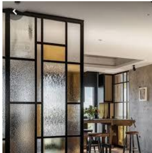
الزجاج في القواطع الداخلية شكل(14)

وان المتخصص في الفراغ الداخلي لا يغيب عن خاطره الزجاج ودوره في تكوين تكاملي للفراغ الداخلي، فالزجاج منذ الازل، ومن يوم اكتشافه الانسان على الارض، اصبح هذه الخامة المهمة والتي تدخل في المعالجات المعمارية عدا طبعا الانية المنزلية xii . ومع تطور الانسان بدا يطور بيئته الداخلية سواء السكن او مكان العمل او المرافق العامة المختلفة من محلات تجارية ومدارس ومستشفيات .. الخ (شكل 14)، وكان همه تكوين توافق ما بين البيئة المحيطة والوظيفة التي ستحققها له، وبما ان الفراغ الداخلي يشكل هذه البيئة الكبيرة والشاملة، فكانت هي من جسدت القيم الجمالية الروحية والاحتياجات ايضا التي تخدم الانسان، والتصميم الداخلي تنوعت مدارسه واختلقت باختلاف الثقافات والعادات والتقاليد والطبيعة الجغرافية ، وبرغم هذا التنوع الكبير الا انها جميعا كانت تهدف الى ترتيب الاسس والعناصر للفراغ الداخلي لتحقيق هدف المنفعة والجمال، ولتلي في النهاية الغرض الذي صممت من اجله xiii .