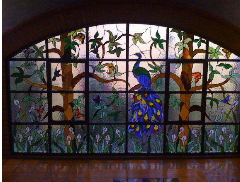
الرسم على الزجاج شكل (15)

ومع استخدام الواح الزجاج بدأت فكرة تحسين المظهر لها ليناسب الازواق المختلفة في معالجة الفراغ الداخلي ، فدخلت تقنية الرسم على الزجاج بموضوعات مختلفة منها الادمية والحيوانية والخطية والزخرفية والهندسية والنباتية (شكل 15)، وكلها كانت توظف لخدمة الفراغ الداخلي حسب استخدامه، فكانت الزخارف الهندسية والكتابية والنباتية تستخدم في المساجد مثل المسجد الاقصى المبارك، والادمية والحيوانية في القصور مثل قصر جاسر في بيت لحم ، وايضا في الاماكن العامة مثل الاسواق والابنية الحكومية وغيرها xiii .