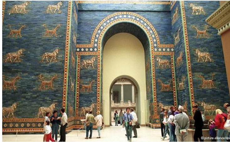
بوابة عشتار شكل (4)

انت صناعة الخزف من الشرق وغالبا من بلاد فارس وشرق اسيا ، وكانت حرفة اساسية عند الرافدين الذين سكنوا بلاد العراق، وبطبيعة سكنهم حول نهري دجلة والفرات ومع توفر الطينة الموجودة على جانبي النهر، ومن مبدأ "ابني بما تحت قدمك"، كان الطمي هو الخامة الاساسية، فصنعت منه الواح الرقم للكتابة وايضا قوالب لصب الطينة بداخلها لاستخدامها للبناء، صنعت ايضا الاختام وجاءت فكرة صناعة بلاطات صغيرة الحجم 1(سم * 1سم) لونت واصبح يطلق عليها الفسيفساء، واجمل شاهد عليها هي بوابة عشتار التاريخية شكل(4)، وتفنونا في صناعة الانية المنزلية من صحن وقدر وكؤوس وغيرها لتشكل فيما بعد ومع التطور حرفة الخزف.