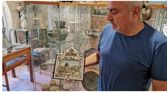
مصنع خزف الارمني (شكل 2)

وموضوعنا هنا الفسيفساء والزجاج كصناعة ارتبطت بالفكر والحياة على ارض فلسطين، فهي ليست صنعة تراثية جميلة فقط، بل شكلت واحدا من اهم رموز الثقافة والهوية الفلسطينية الوطنية، فهي صناعة تاريخية من ايام حكم الكنعانيين حتى وقتنا الحالي، فورها الابناء عن الاباء وتوارثوها من جيل الى جيل. وتطورت صناعة الخزف والزجاج قبل 400 عام عندما بدأت عمليات ترميم المسجد الاقصى المبارك ايام الاتراك العثمانيين، وبدأت الصنعة بالانتشار بعد انشاء اول مصنع في القدس على يد رجل ارمني من عائلة كركشيان، وقد احترفت العائلة الصنعة من اربعة اجيال ماضية، وكان ذلك في العام 1922م.(شكل 2).