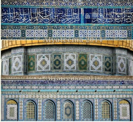
فسيفساء قبة الصخرة الشريفة (شكل 6)

الاسلوب الاول وهو الخزف المستخدم للجدران وكان يطلق عليها القيشاني، وينسب الاسم الى مدينة قاشان، وهي احدى المدن الايرانية والتي اشتهرت بهذه الصنعة وبقي الاسم مرتبط بها حتى وقتنا الحالي. وفي بلاد المغرب اطلق عليه الموزاييك (شكل 5)، والذي استخدم لزيين الجدران والارضيات. وفي بلاد الشام والعراق اطلق عليه الفسيفساء والتي شاع استخدامها بكثرة من ايام البيزنطيين والذين استخدموها في الكنائس، وانتقلت بعدها لتزيين العماير الاسلامية المتنوعة، وشاهد عليها ما زينت به قبة الصخرة الشريفة في القدس (شكل 6).