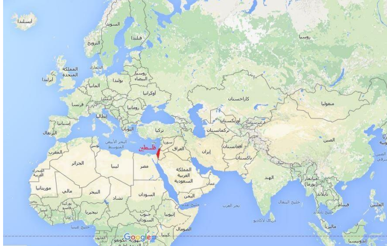
خارطة فلسطين (شكل 1)